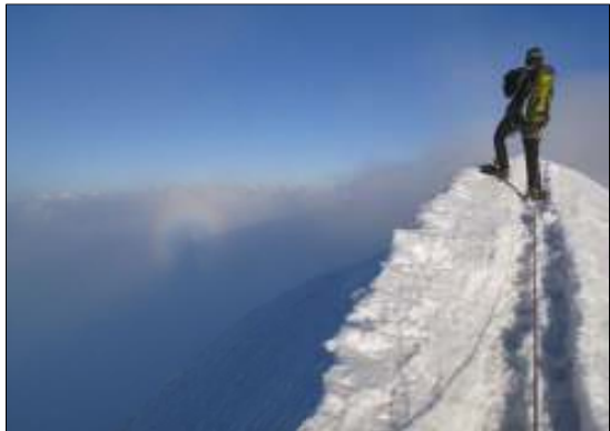
Brockengespenst am Castor VS.

Wanderer, Berggängerinnen und Skitourenfahrer sind fotografisch nach dem grossen Lowa-Photowettbewerb des letzten Jahres schon wieder gefordert: mit einem Wettbewerb der Outdoor-Plattform MountEverest.ch. Unter dieser Adresse können Teilnehmer ihre Schnappschüsse aus den Schweizer Bergen deponieren. Eine Jury wählt pro Jahreszeit das schönste Bild. Als Wettbewerbspreise winken tolle iPads.